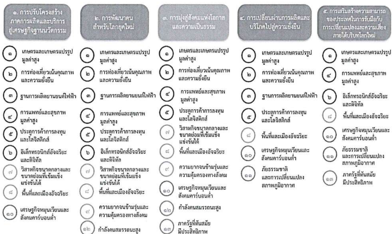
แผนภาพที่ ๓.๑ ความเชื่อมโยงระหว่างหมุดหมายการพัฒนา กับเป้าหมายหลัก

ความเชื่อมโยงระหว่างหมุดหมายการพัฒนา กับเป้าหมายหลักแสดงไว้ในแผนภาพที่ ๓.๑ โดยหมุดหมายการพัฒนาที่กำหนดขึ้นเป็นประเด็นที่มีลักษณะเชิงบูรณาการที่ครอบคลุมการพัฒนาตั้งแต่ในระดับต้นน้ำจนถึงปลายน้ำ และสามารถนำไปสู่ผลพัฒนาทั้งในมิติเศรษฐกิจ สังคม ทรัพยากรธรรมชาติและสิ่งแวดล้อมไปพร้อมๆ กัน ทำให้หมุดหมายแต่ละประการสามารถสนับสนุนเป้าหมายหลักได้มากกว่าหนึ่งข้อ นอกจากนี้การพัฒนาภายใต้แต่ละหมุดหมายไม่ได้แยกขาดจากกัน แต่มีการสนับสนุนหรือเอื้อประโยชน์ซึ่งกันและกัน